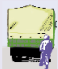
und an den Rückseiten