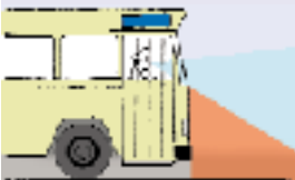
an den Vorderseiten von Bussen und LKWs